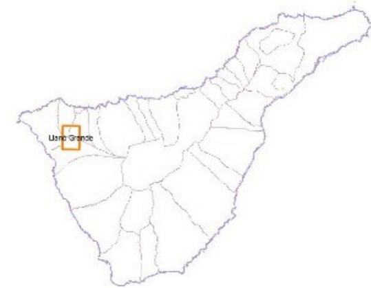
Isla de Tenerife